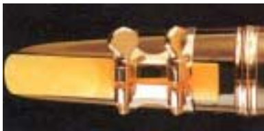
Imboccatura ad ancia semplice