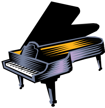
Cassa di risonanza